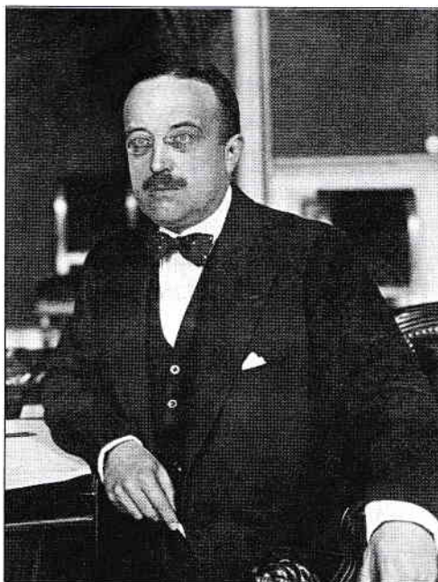
André Tardieu în biroul său în timpul Conferinței de Pace din 1919.