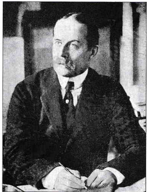
Sir Eyre Crowe în 1911.

Dincolo de forța Imperiului Britanic pe care îl reprezenta, Sir Eyre Crowe era el însuși un personaj extrem de puternic, cu o carieră aparte în diplomația britanică. În 1919 ocupa funcția de secretar de stat ad-